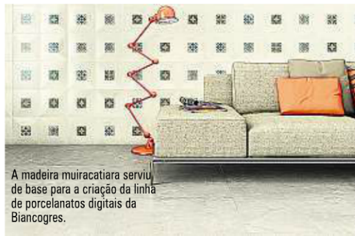
A madeira muiracatiara serviu de base para a criação da linha de porcelanatos digitais da Biancogres.