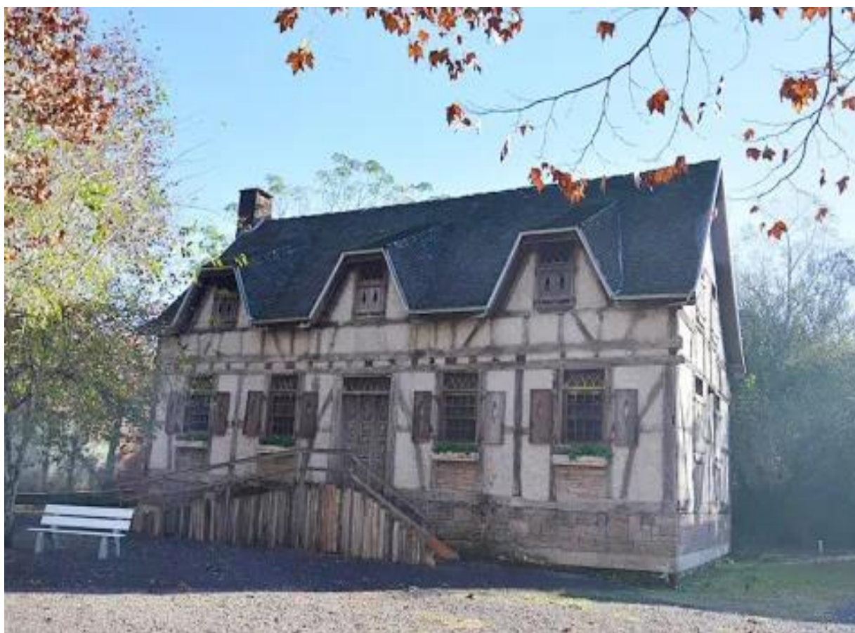
Figura 2 - Falso Histórico em Ivoti/RS

Devido à falta de formação específica e de informação, que faz parte da bagagem laboral dos profissionais da arquitetura e urbanismo que se dedicam aos afazeres relativos ao Patrimônio Cultural, por vezes e desavisadamente um pastiche pode ser identificado por um leigo, sem formação específica, como de relevância cultural e histórica. Como ilustração a esse entendimento, trazemos o exemplo do falso histórico localizado no Núcleo de Casas Enxaimel, no município de Ivoti, RS, construído quase um século depois do conjunto original. O núcleo contém uma edificação entendida como um caso de FALSO HISTÓRICO localizado entre um conjunto de edificações significativas a memória e cultura estadual. O falso histórico é assim classificado por apresentar uma técnica construtiva e representatividade histórico e cultural diferentes daquela reconhecida pelos pareceres técnicos que levaram ao tombamento nacional deste conjunto histórico da cidade de Ivoti.