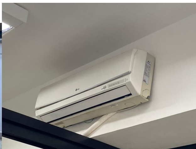
- Lotes 07, 08 e 09: