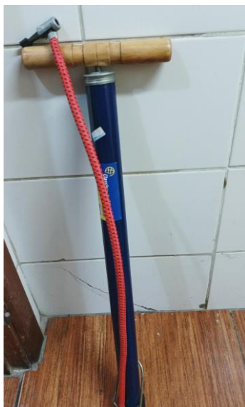
- Lotes 28, 29 e 30: